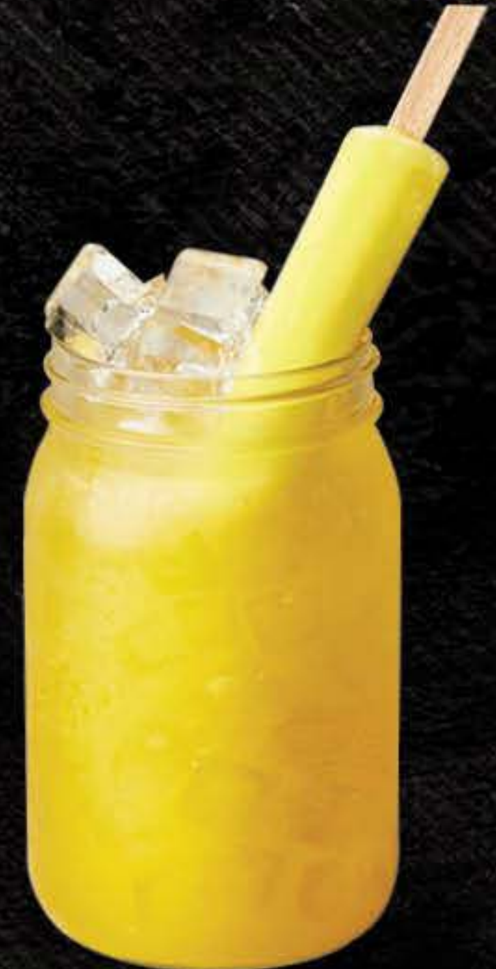
COPACABANA (1 LITRE)

Red Bull Red Edition Tequila Hornitos Reposado Cointreau Aloe Vera melon d'eau Sirop de rhubarbe Purée de fraises Jus de lime