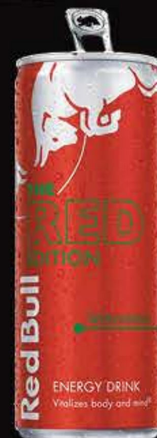
REDBULL RED EDITION (MELON D'EAU)