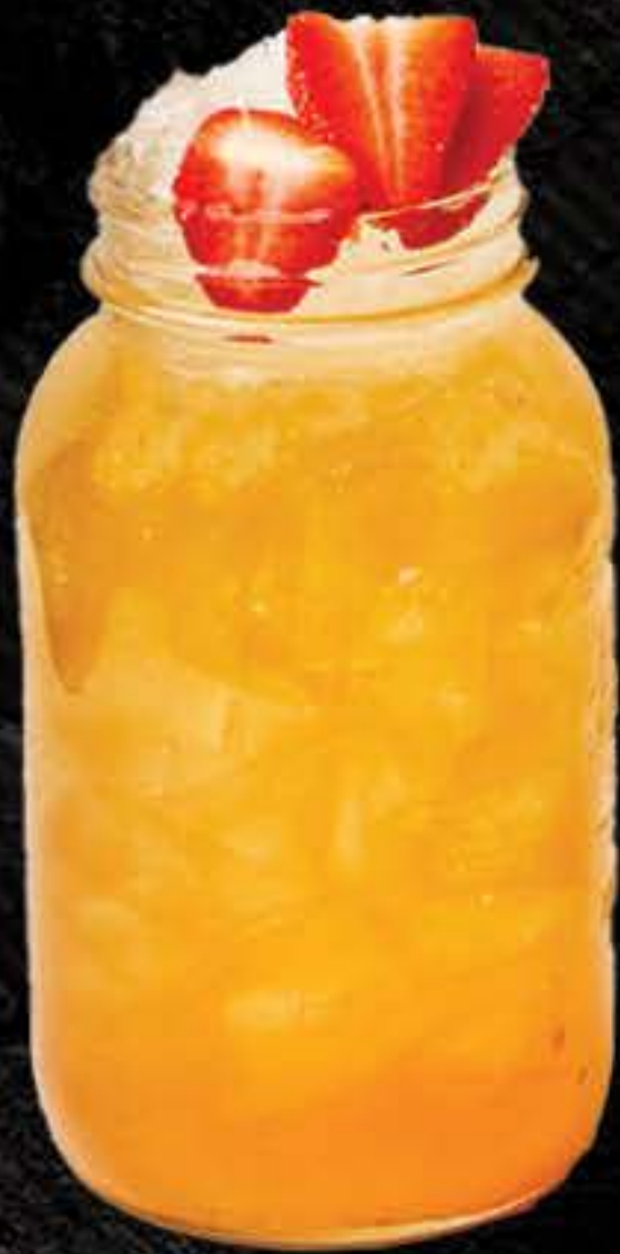
DIVA (1 LITRE)

Red Bull Sans Sucre Tanqueray Malaca Southern Comfort Sirop d'abricot Purée de fraises Jus de lime Soda