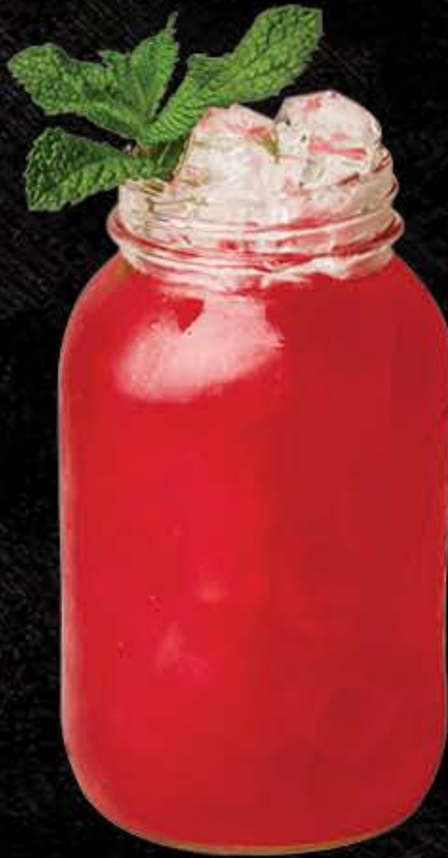
YEET (1 LITRE)

Red Bull Sans Sucre Tanqueray Malaca Southern Comfort Sirop d'abricot Purée de fraises Jus de lime Soda