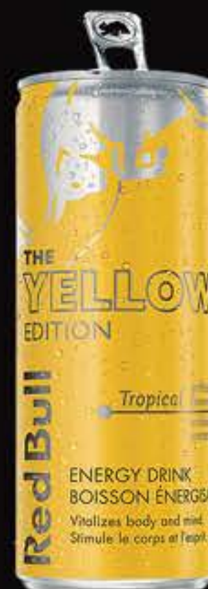
REDBULL JAUNE (TROPIQUE)