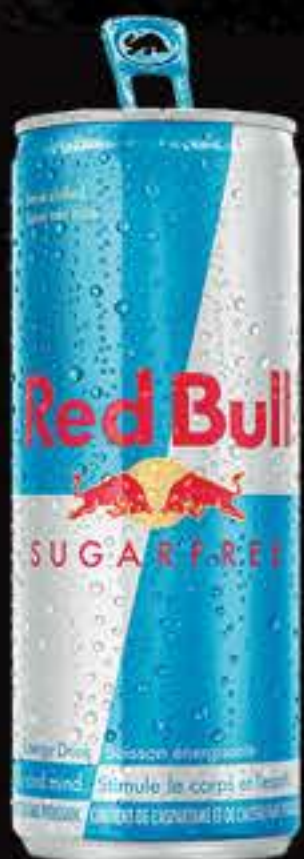
REDBULL SANS SUCRE