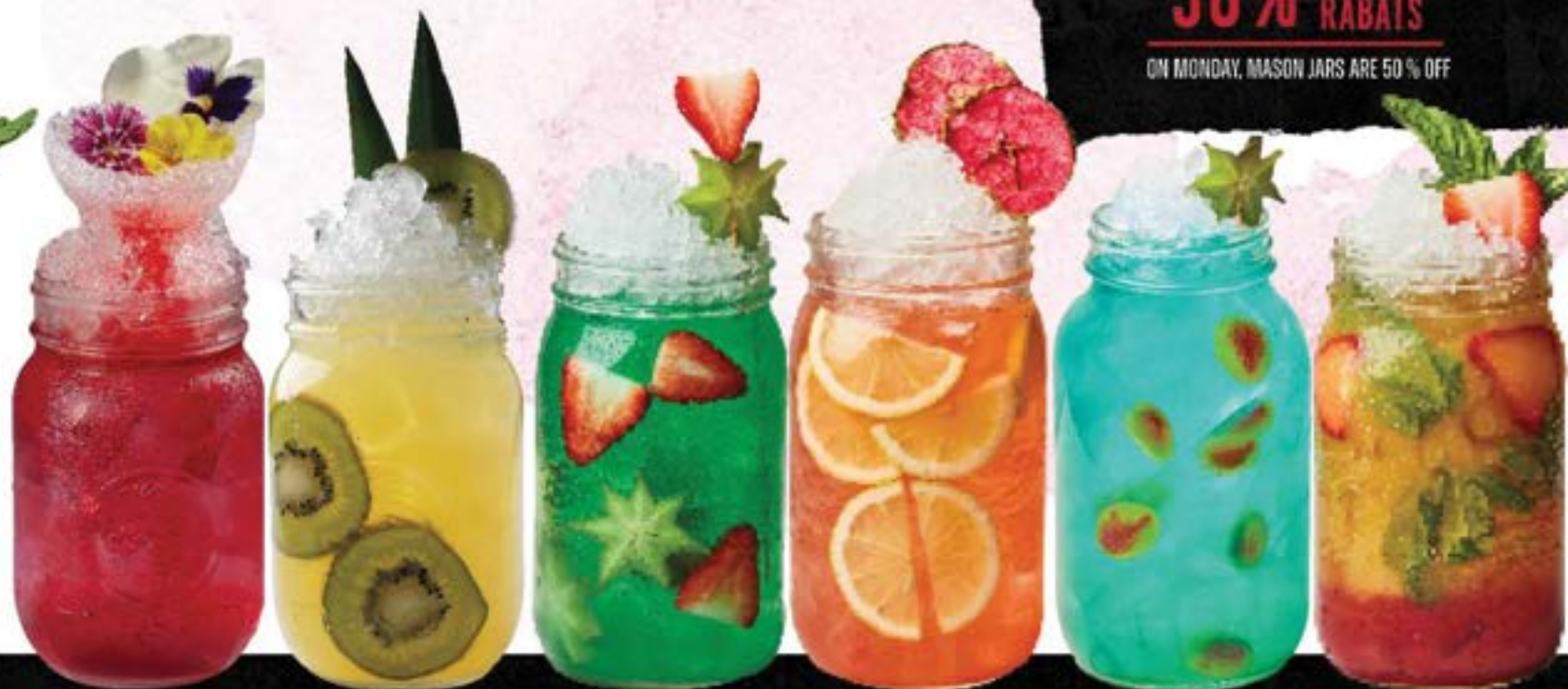
LA BELLE EN FLEUR